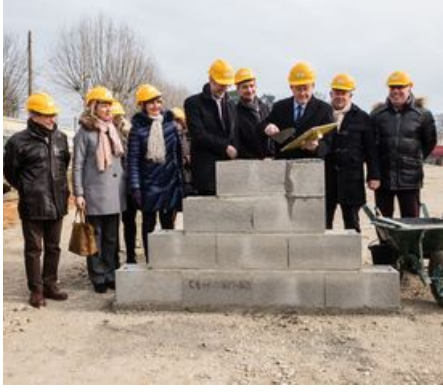
Pose de la première pierre par le maire entouré de ses élus, le 28 février 2018.