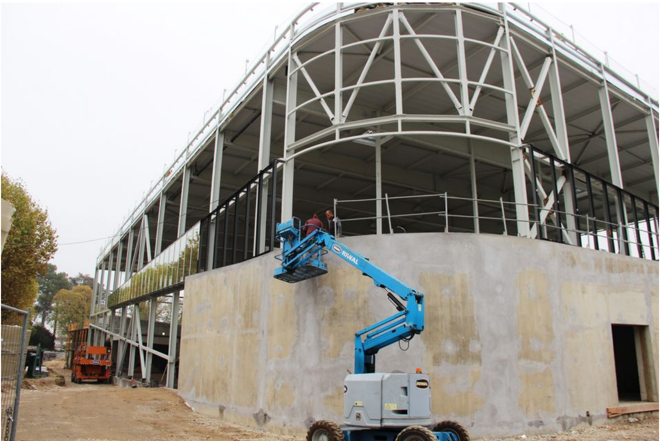
La silhouette impressionnante du bâtiment se dresse au fond du terrain de football.

Début octobre 2018, la structure du Gymnase et du Centre de loisirs est achevée. L'impressionnant bâtiment prend forme, les vitres commencent à être posées.