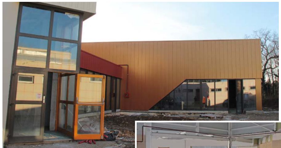
Un nouveau module de 200 m 2 a été créé. Un nouveau dojo y sera prochainement installé dans la continuité du grand dojo existant.

Enfin, l'accessibilité du bâtiment a été améliorée, avec une entrée plus accueillante sur le rond-point, et la rénovation des façades lui donne une seconde jeunesse. Les clubs pourront réinvestir les lieux d'ici la fin du mois de février.