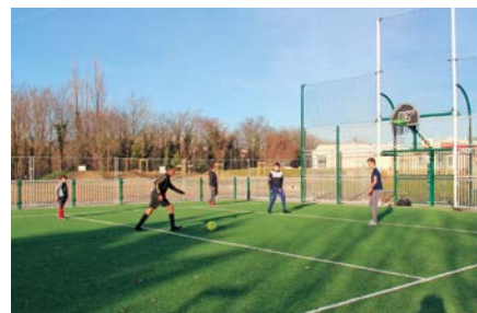
Le city stade, en libre accès pour tous.