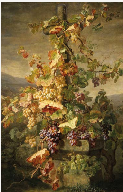
Vigne à la croix de Jean-Pierre Laÿs (1862) Musée des Beaux-Arts de Lyon.

Très vite il reçoit divers prix en France comme à l'étranger pour ses tableaux. Fleurs et fruits sont ses sujets de prédilection, tout comme la religion. Restant modeste, Laÿs se contente de peindre des petits formats qui trouvent facilement preneur et lui permettent de vivre comme un propriétaire rural aisé. Il obtient de nouveaux succès et à l'Exposition de Paris en 1867, une Vierge aux roses est achetée 3000 F par la Maison de l'Empereur. Il vend des huiles et aquarelles en Hollande, Autriche, Suisse... Après un voyage en Italie de 3 mois en 1886, il se réinstalle à Écully et y meurt en décembre 1887. Il est enterré dans son village natal de Saint-Barthélémy-Lestra.