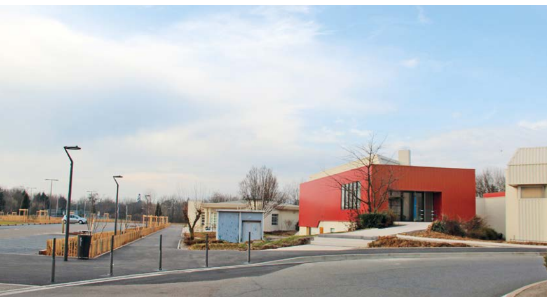
L'entrée de la Maison des Sports a été réaménagée pour être plus accueillante et plus accessible. Un vaste parking paysager permet aux usagers de disposer de 270 places de stationnement.