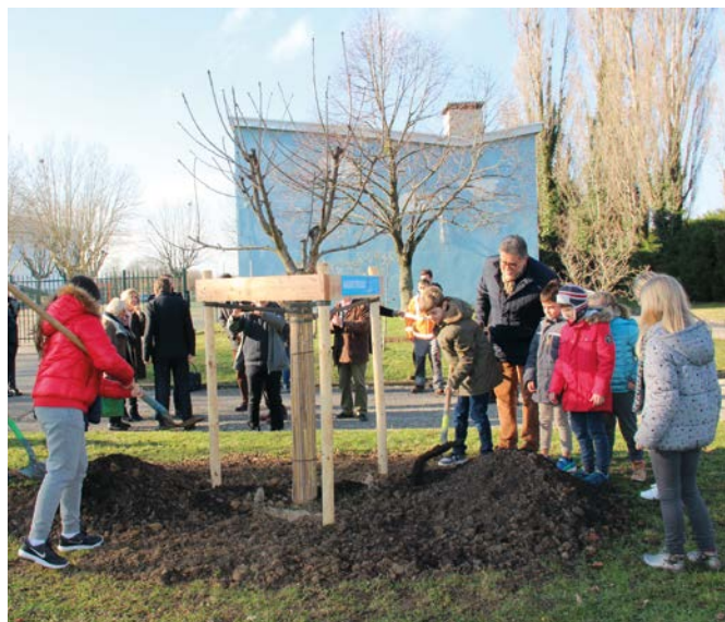
Le 15 e arbre de la Solidarité a été planté à l'école des Cerisiers, au profit du Foyer Notre-Dame des sans-abri.

La Ville veille également à la longévité de ses arbres anciens. Ainsi pour éviter que les piétinements ne fragilisent le cèdre remarquable du Jardin de la Condamine, un périmètre de protection a été délimité à son pied et un aménagement réalisé