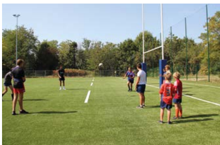
Le terrain de rugby synthétique.