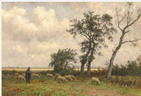
Paysage à Drenthe, huile sur toile, Rijksmuseum Amsterdam