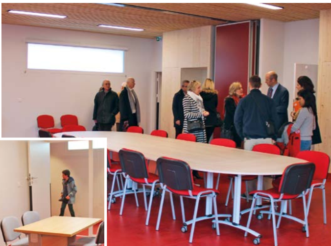
L'Espace ressources comprend une grande salle de conférence, modulable pour accueillir des ateliers, ainsi que des bureaux.

Détails, dates et tarifs de tous ces ateliers à retrouver à la Maison de la Famille ou sur le site de la ville, www.ecully.fr rubrique À tout âge/Famille.