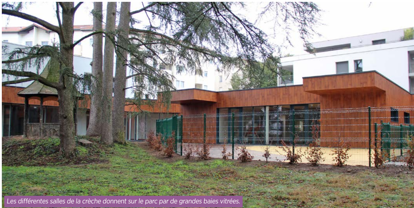
Les différentes salles de la crèche donnent sur le parc par de grandes baies vitrées.

D ans la deuxième partie du bâtiment, au cœur du parc, la Maison de la Famille accueille une crèche, implantée pour fonctionner en symbiose avec la nature. C'est la crèche Trottinette qui y a été transférée, avec une capacité portée de 20 à 36 places d'accueil. Elle comporte un espace bien distinct pour les 2-3 ans, au format jardin d'enfants, avec un espace extérieur dédié. Une autre salle constitue un espace multi-âge pour les 0-2 ans, modulable en deux parties distinctes, pour être adaptable aux besoins des enfants, ouvrant également par de grandes baies vitrées sur un espace de jeu extérieur. L'ensemble est doté de mobilier ergonomique adapté à chaque tranche d'âge. La crèche dispose également de deux dortoirs, d'une salle de restauration et d'une salle de motricité qui pourra être utilisée par les Relais Assistants Maternels.