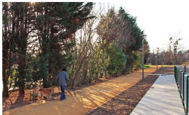
Une véritable trame végétale et un cheminement piéton ombragé structurent les espaces extérieurs.

La transformation du site fait la part belle aux aménagements paysagers. Un parking principal, sur l'ancien emplacement du COSEC offre 148 places, auquel s'ajoute un espace central en herbe qui propose une réserve de 42 places supplémentaires en cas de besoin. Un deuxième espace enherbé, sur le côté de la Maison des Sports servira de parking occasionnel les jours de grandes manifestations. Entre ces espaces de stationnement une trame végétale a été plantée de près de 200 arbres et arbustes, qui offrira un cadre verdoyant aux beaux jours. Avec le parking qui dessert le nouveau gymnase et l'école des Cerisiers, ce sont 270 places de stationnement qui ont été créées.