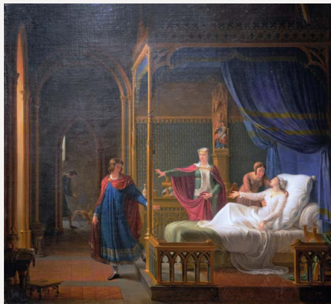
Illustration du style troubadour, La déférence de Saint-Louis pour sa mère de Fleury François Richard (1808) Musée des Beaux-Arts de Lyon.

À l'âge de 57 ans, il s'installe à Écully, alors que sa santé défaillante ne lui permet plus de peindre. Il achète un domaine de plus de 13 hectares appelé Pont-Tourné et se consacre alors à l'écriture et à la gestion de ses terres. Il rédige ses souvenirs, des notices sur les peintres et un ouvrage sur l'enseignement de la peinture avant de s'éteindre à Écully en 1852. Son neveu, le général Richard héritera du domaine et le cédera en 1902 au soyeux Maurice Isaac qui fera raser la maison pour bâtir le château de Pontourné que l'on connaît aujourd'hui.